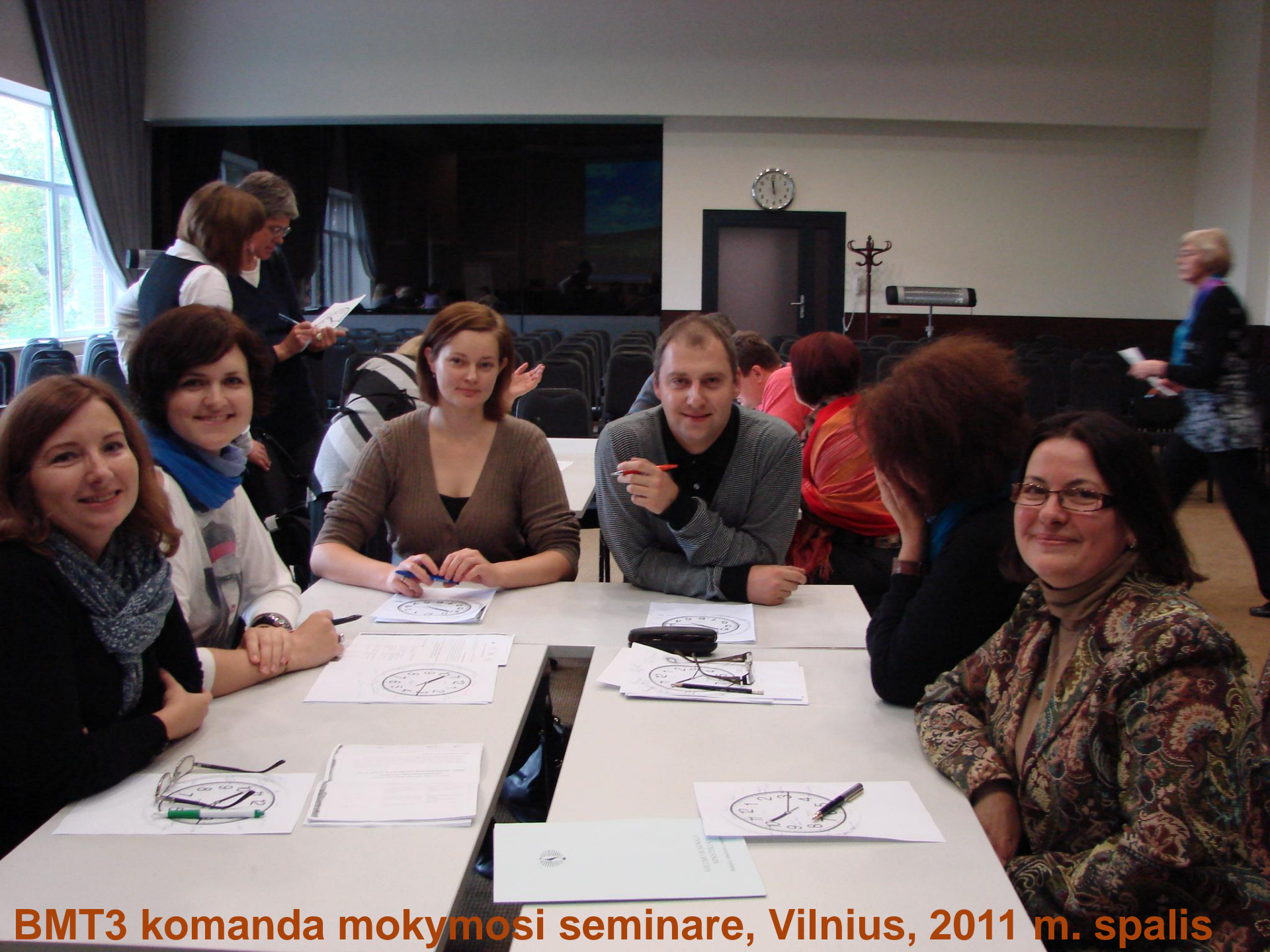
BMT3 komanda mokymosi seminare, Vilnius, 2011 m. spalio