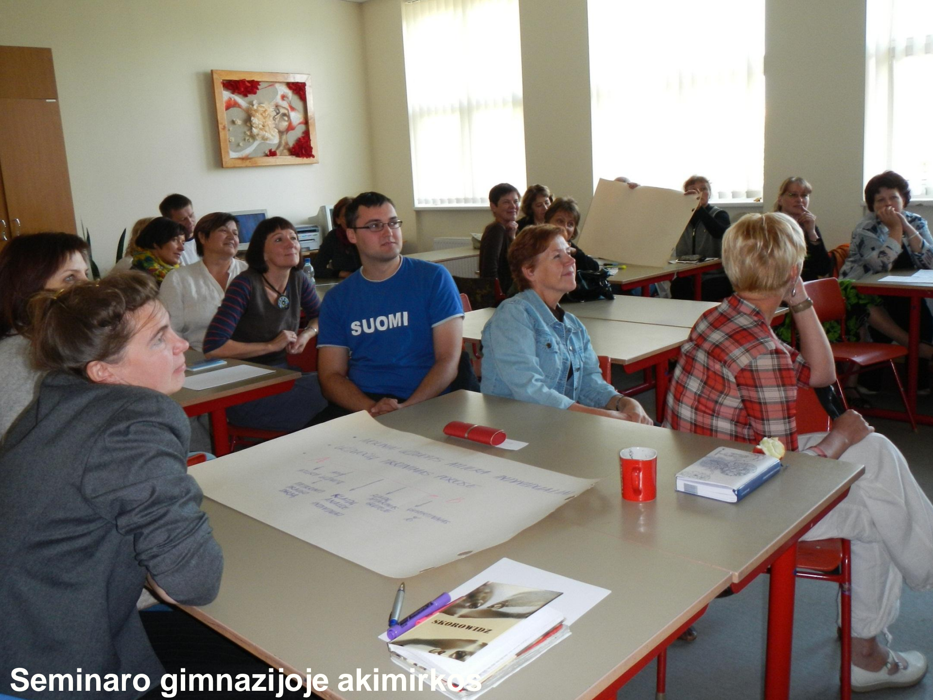
Seminaro gimnazijoje akimirkos